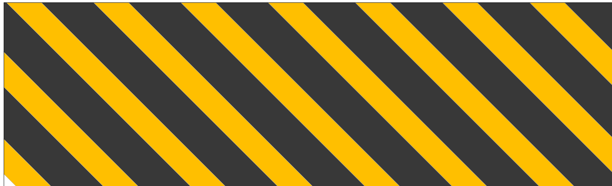
LOMBADA ESC _____ SEM ESCALA

COMPRIENTO VARIÁVEL DE ACORDO COM LARGURA DA RUA